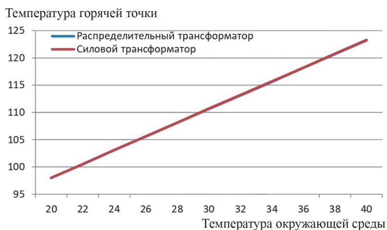
Рис. 1. Зависимость температуры наиболее нагретой точки обмотки трансформаторов от температуры окружающей среды